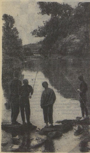
«РЫБАЛКА НА РЕКЕ УЖ»

К. БРУНОВА. (Наш специальный корреспондент. Новополеводский край, Новополеводский район, тригорнолеская средняя школа № 2.